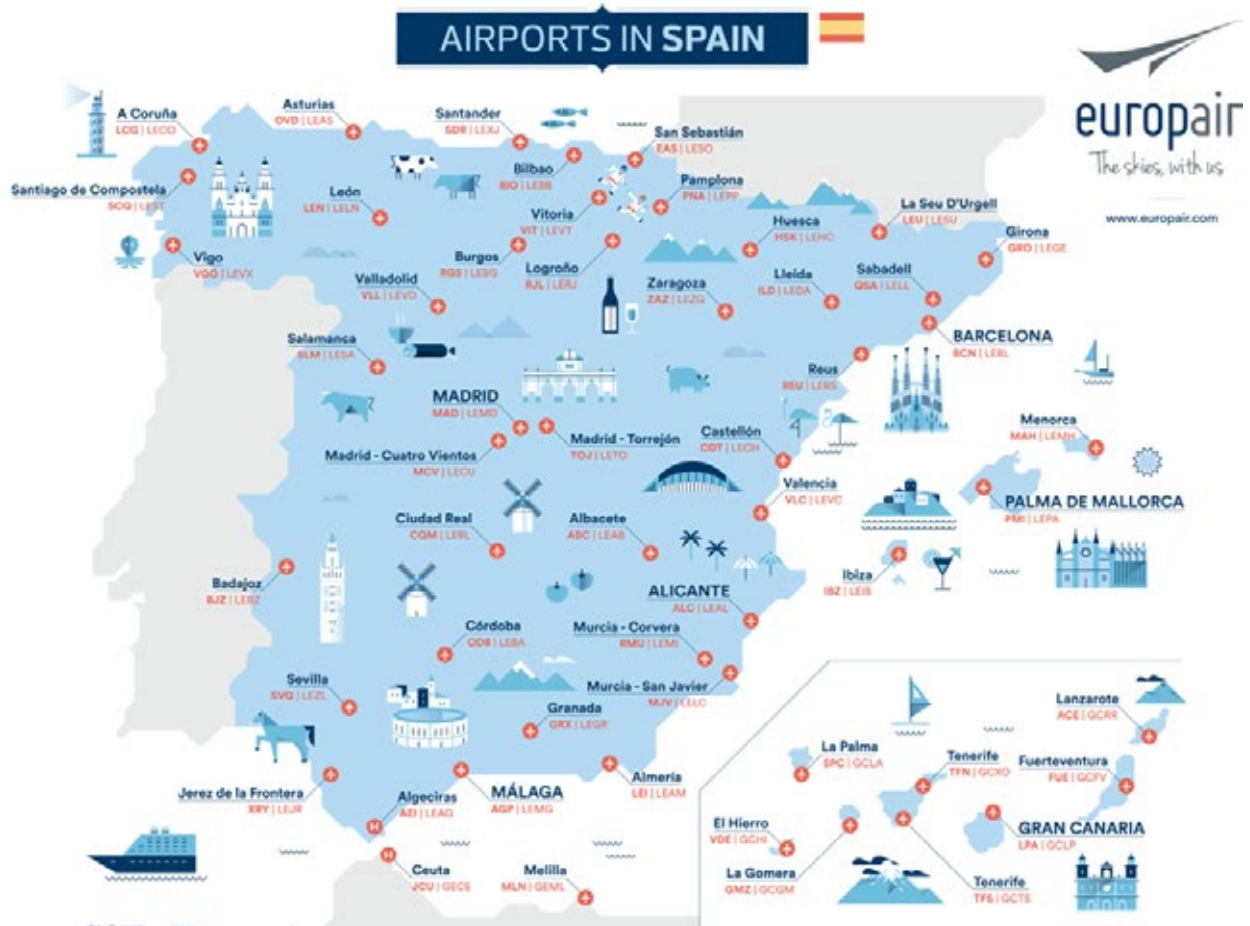
Mapa 2. Aeropuertos españoles